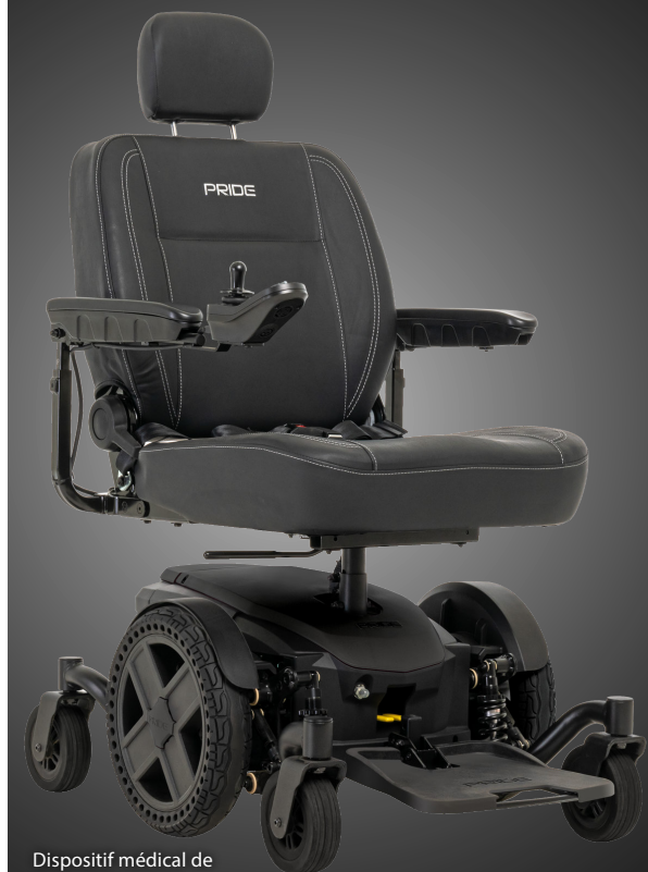
Dispositif médical de classe II de la FDA